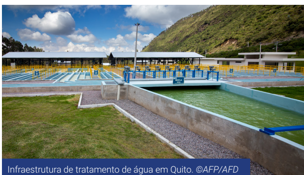
Infraestrutura de tratamento de água em Quito.

Tendo isso em mente, o Grupo AFD e a Comissão estão se mobilizando para melhorar os serviços de água e saneamento prestados à população, tanto nos grandes centros urbanos quanto nas áreas rurais ou em territórios afetados por crises. Essas intervenções são projetadas levando-se em conta os riscos climáticos, tais como inundações, e podem levar ao desenvolvimento de soluções inovadoras, como o reuso de águas residuais para a agricultura.