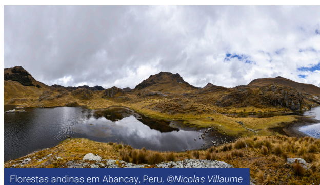
Florestas andinas em Abancay, Peru.