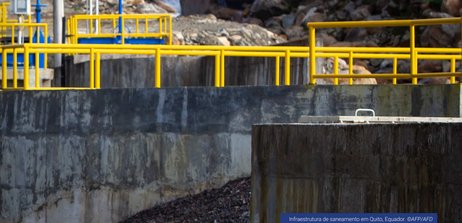
Infraestrutura de saneamento em Quito, Equador.