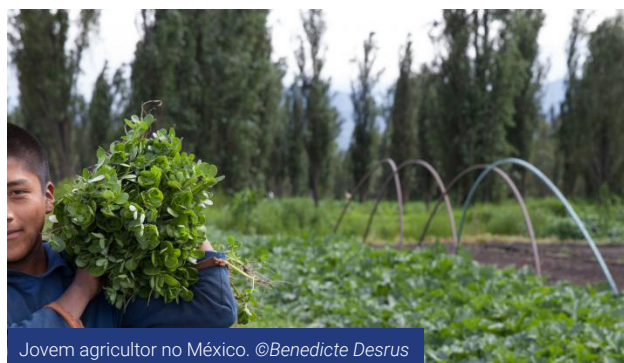
Jovem agricultor no México.