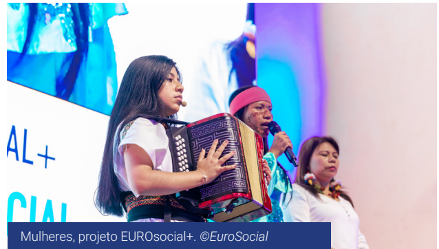
Mulheres, projeto EUROsocial+.