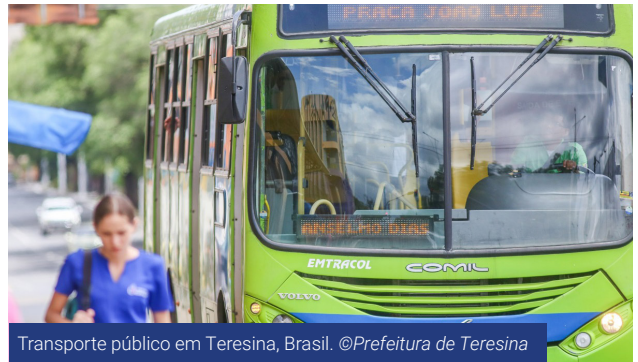
Transporte público em Teresina, Brasil.