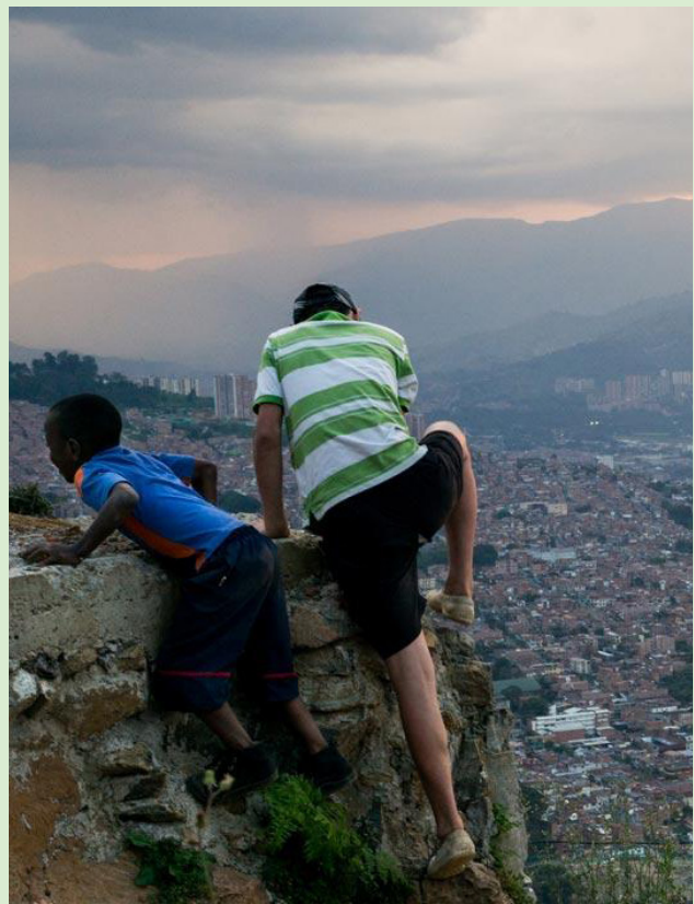
Mecanismo de pesquisa para aprofundar o conhecimento sobre as desigualdades na Colômbia e no México, financiado pela Comissão Europeia.