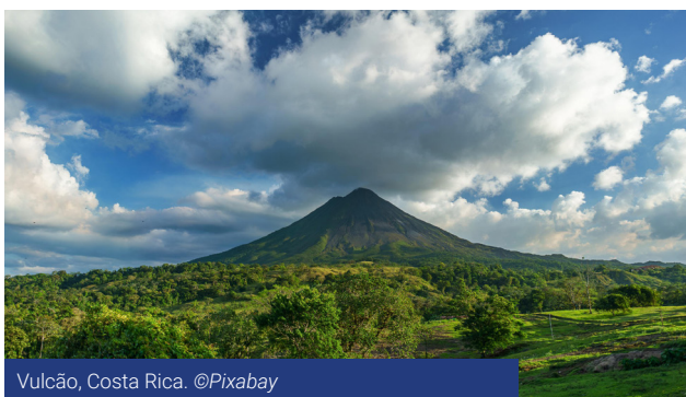
Vulcão, Costa Rica.

Para acompanhar os países latino-americanos no desenvolvimento de serviços bancários mais abertos às populações sub-bancarizadas, a AFD e a Comissão Europeia trabalham em conjunto, com os governos e seus parceiros, no sentido de apoiar a reforma das políticas públicas nos setores financeiros e a elaboração de novos produtos “verdes” e sociais inovadores. São ações em prol de dispositivos de financiamento inclusivo, visando a realização dos Metas de desenvolvimento sustentável.