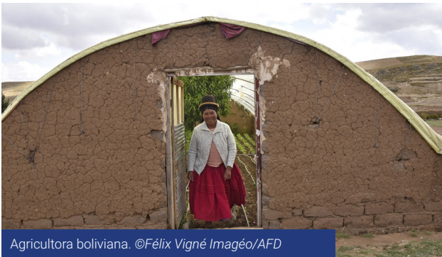
Agricultora boliviana.

Na América Latina, a atuação em parceria do Grupo AFD e da União Europeia se manifesta por meio do EUROsocial+, um programa de cooperação implementado por um consórcio liderado pela FIIAPP (Espanha), e que reúne a Expertise France, a Organização Internacional Ítalo-Latino Americana (IILA) e a Secretaria da Integração Social Centro-Americana (SISCA). As ações do programa focam principalmente nas áreas de igualdade de gênero, governança e políticas sociais.