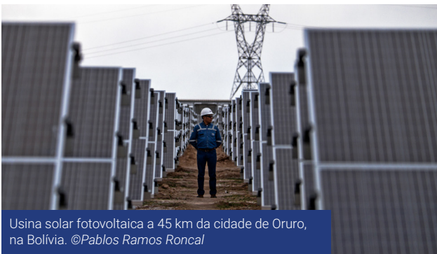
Usina solar fotovoltaica a 45 km da cidade de Oruro, na Bolívia.

Para enfrentar esses dois problemas, é essencial que haja um investimento maciço e concertado em prol do acesso universal à geração de energia eficiente e descarbonada. O espírito da parceria entre a AFD e a União Europeia se construiu no sentido de viabilizar parte desse investimento, mediante intervenções concretas e pautadas em três eixos-chave: o acesso universal à eletricidade, incluindo as áreas rurais; a interconexão regional de redes elétricas, e o financiamento das energias renováveis.