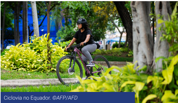
Ciclovía no Equador.

Juntamente com a Comissão Europeia, o Grupo AFD visa alcançar um reequilíbrio territorial em benefício dos territórios desfavorecidos na América Latina, focalizando seu trabalho, em especial, no apoio ao desenvolvimento urbano mediante diversas intervenções em diferentes setores: desenvolvimento urbano, saúde, educação social, transporte, a fim de apoiar políticas públicas locais cujo objetivo básico é melhorar as condições de vida das populações urbanas.