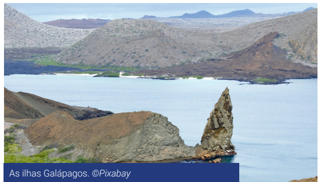
As ilhas Galápagos.